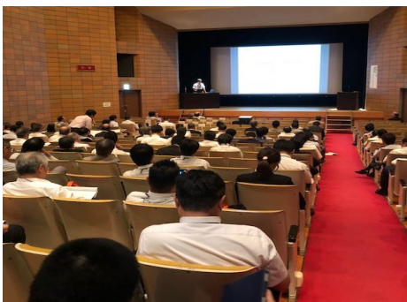
講演会・合同成果発表会

(3) 参加：322名（企業95名、公設試91名、産総研51名、官公庁・財団47名、大学・研究機関12名、その他26名）