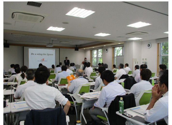
令和元年度第1回東北航空宇宙産業広域連携フォーラム(2019.8.6 会津大学先端ICTラボ)

https://www.aist.go.jp/tohoku/asist/sgl/taif/index.html