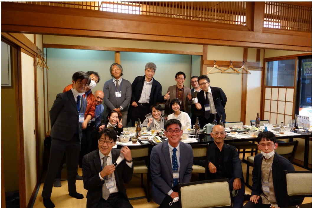
意見交換会（大漁にて）