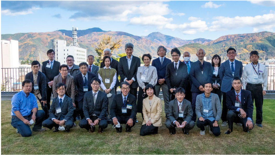
集合写真（まつもと市民芸術館 テラスにて）