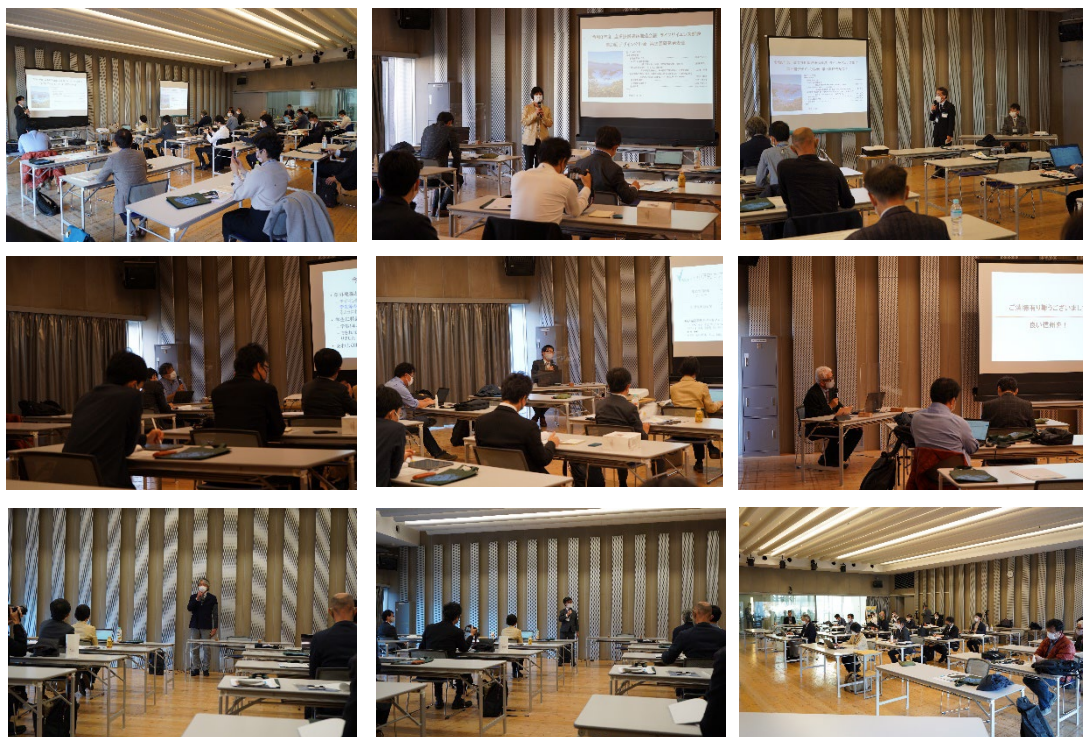
研究発表会、全体会議（まつもと市民芸術館 スタジオ2）