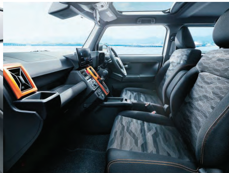
9インチスマリ連携ディスプレイオーディオはメーカーオプション