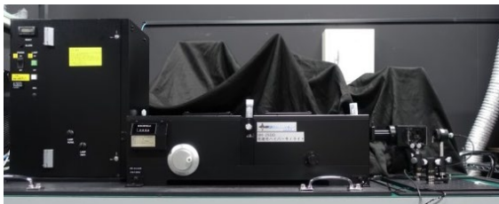
紫外放射照度計校正装置

共同研究により、UV-LED用紫外放射照度計の開発と、その校正技術の確立に成功!